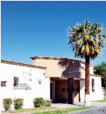
Instituto de Cultura de Baja California, Mexicali.

El Instituto de Cultura de Baja California (ICBC) y los diferentes centros culturales de los municipios promueven el aprecio y disfrute cultural en la entidad, organizando actividades artísticas y culturales para los bajacalifornianos y turistas, dentro de un marco de respeto a la diversidad.