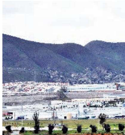
Parque industrial, Tijuana, Baja California.

< http://sic.conaculta.gob.mx/lista_mv.php?table=centro_cultural&disciplina=&estado_id=2&municipio_id=&paso=10&offset=0 >.