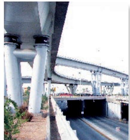
Diseño y construcción de vialidades.