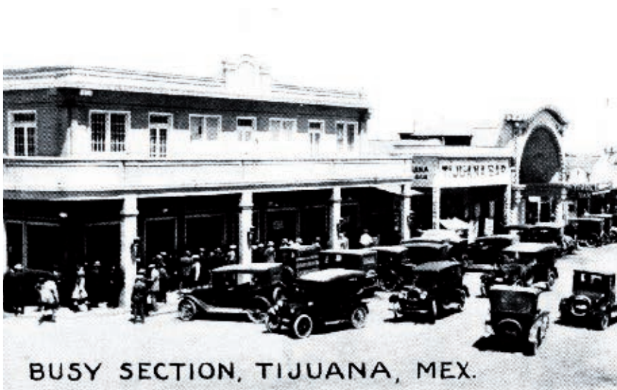
El turismo y el comercio se incrementaron en 1920.