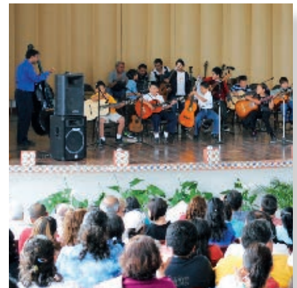
Concierto infantil, Centro Cultural Riviera.

Las actividades artísticas que se llevan a cabo en el estado, como la danza, el teatro, la música, la fotografía, la literatura y las artes plásticas, como la pintura y la escultura, han destacado a nivel nacional e internacional.