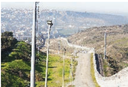
Frontera de Tijuana con Estados Unidos de América.