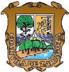
Escudo oficial del Estado Libre y Soberano de Coahuila de Zaragoza.

Algunos historiadores piensan que nació de coatl , una palabra en lengua náhuatl que quiere decir “culebra”, y de huilana , “arrastrarse”, lo cual se interpretaría como “lugar donde se arrastran las culebras”; o también de coatl y huila (de huilota, que es el nombre de una paloma), y significaría “víbora que vuela”. En la actualidad, lo más aceptado es que la palabra Coahuila proviene del zahuatl o coahuilteco, lengua que hablaban los indígenas de las regiones cercanas a lo que hoy es la ciudad de Monclova. Antiguos frailes franciscanos que conocían esta lengua dijeron que la palabra Coahuila provenía de quahuatl , “árbol”, y la “abundancia”, lo que significa “bosque” o “lugar donde abundan los árboles”.