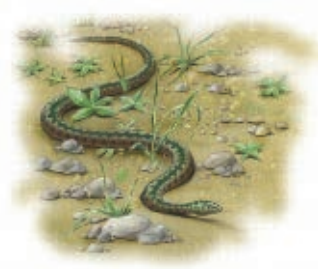
Algunos creen que la palabra Coahuila proviene de culebra .

Algunos historiadores piensan que nació de coatl , una palabra en lengua náhuatl que quiere decir “culebra”, y de huilana , “arrastrarse”, lo cual se interpretaría como “lugar donde se arrastran las culebras”; o también de coatl y huila (de huilota, que es el nombre de una paloma), y significaría “víbora que vuela”. En la actualidad, lo más aceptado es que la palabra Coahuila proviene del zahuatl o coahuilteco, lengua que hablaban los indígenas de las regiones cercanas a lo que hoy es la ciudad de Monclova. Antiguos frailes franciscanos que conocían esta lengua dijeron que la palabra Coahuila provenía de quahuatl , “árbol”, y la “abundancia”, lo que significa “bosque” o “lugar donde abundan los árboles”.