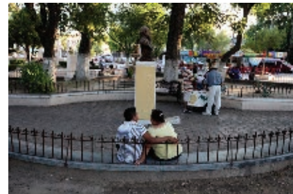
Plaza de la zona centro de Ciudad Acuña.

Los ayuntamientos están integrados por un alcalde; uno o dos síndicos; el cabildo , que son los regidores, y un secretario. Al alcalde se le llama también presidente municipal y es el responsable de dirigir y organizar todo lo que beneficie a los habitantes del municipio. El cabildo es un grupo de mujeres y hombres que han demostrado su compromiso con la sociedad, y han trabajado para mejorar su municipio. Junto con el alcalde, toman decisiones en asambleas sobre administración de servicios como agua, luz, drenaje y seguridad; esto por mayoría de votos, es decir, en forma democrática. Alcalde y cabildo son los responsables de salvaguardar los intereses del municipio. Cada cuatro años se elige un nuevo alcalde, y su cabildo mediante la votación libre de los ciudadanos. El síndico es el representante legal del municipio.