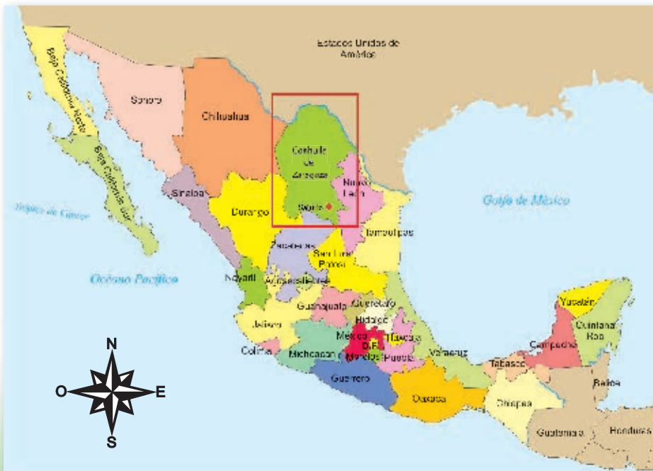
Ubicación geográfica del estado de Coahuila de Zaragoza.

Todos los estados tienen una capital, que es la ciudad en donde reside el gobierno estatal.