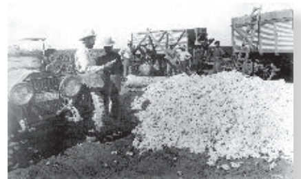
Jornaleros cargando los contenedores para transportar algodón, 1917.

Los corridos revolucionarios han dejado huella en la tradición histórica y musical del país; con ellos puedes conocer hechos relevantes, personajes importantes y episodios de esa época, en algunas ocasiones de modo humorístico.