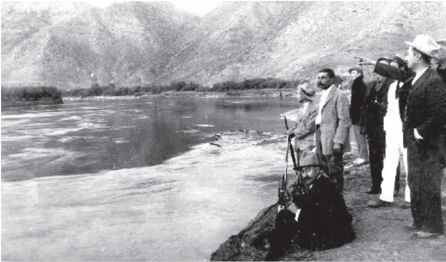
Inspección del río Colorado, 1917.

El desierto en torno al río Colorado se transformó en campos de cultivo de trigo y algodón, que se exportaban a Estados Unidos. En esta zona de Baja California había pocos habitantes mexicanos, por lo que las compañías estadounidenses que cosechaban algodón se vieron en la necesidad de contratar personas de origen chino para trabajar en el campo.