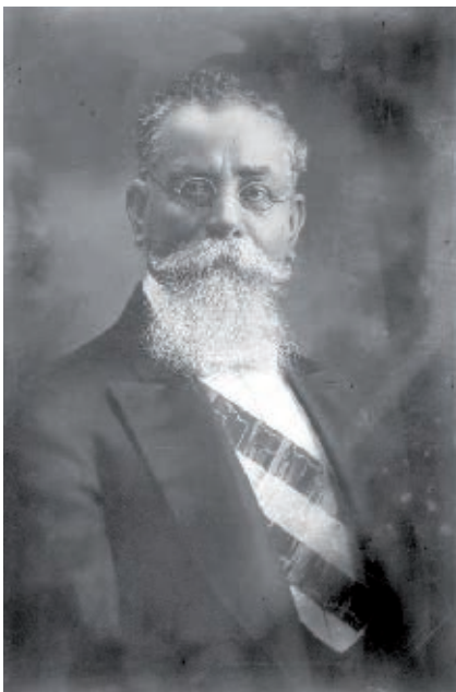
Venustiano Carranza, presidente de México del 1 de mayo de 1917 al 21 de mayo de 1920.

Ricardo Flores Magón siguió criticando la situación nacional y propuso que la lucha armada debía continuar hasta que cambiaran las pésimas condiciones de vida de la población mexicana. Sin embargo, no encontró suficiente apoyo y el movimiento no pudo continuar.