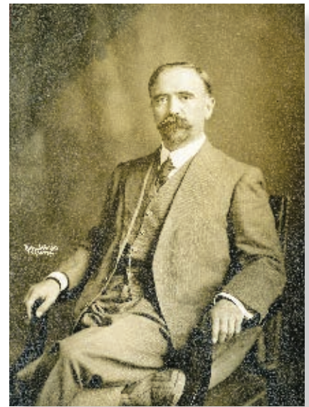
Francisco I. Madero, al proclamarse en contra del gobierno de Porfirio Díaz con la frase de "Sufragio efectivo, no reelección", da inicio a la Revolución Mexicana en 1910.

La Revolución Mexicana, liderada por Madero, triunfó. En mayo de 1911, Porfirio Díaz renunció a la presidencia de México y abandonó el país. Varios de los rebeldes en Baja California pensaron que la lucha había terminado.