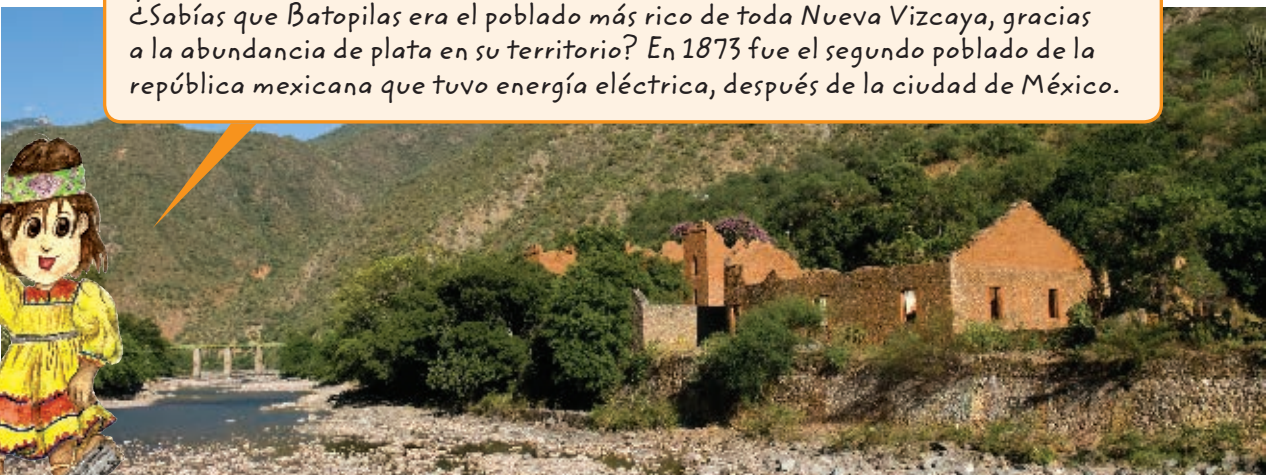
Hacienda a orilla del río en Batopilas, Chihuahua.