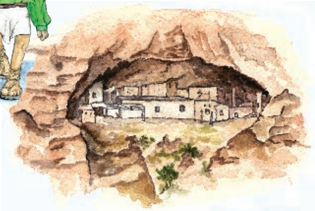
Cuarenta Casas, Madera, Chihuahua. Periodo prehispánico.

Observa en las siguientes ilustraciones algunos cambios que sucedieron desde el periodo prehispánico hasta el Virreinato.