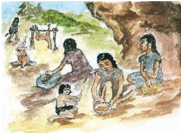
La cocina de los primeros habitantes.