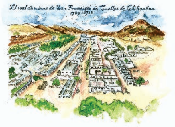
Ciudad de Chihuahua en la época virreinal, 1709-1718.