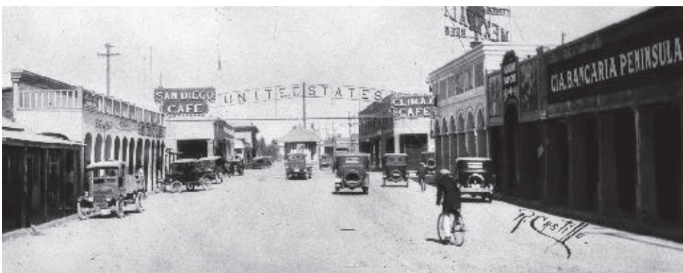
Calle de Tijuana hacia Estados Unidos, 1920.

Años más tarde, el oro disminuyó en Real del Castillo y con ello el número de habitantes. Varios de ellos se dirigieron a Ensenada, localidad que creció en importancia comercial por ser el punto de entrada marítima a la región norte de Baja California. En 1882, la cabecera política del Partido Norte se desplazó a Ensenada.