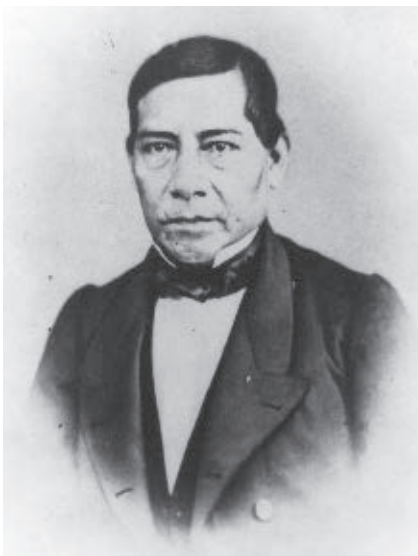
Benito Juárez (1806-1872) fue presidente de México en varias ocasiones, del 18 de diciembre de 1857 al 18 de julio de 1872.

La guerra entre liberales y franceses no afectó al Partido Norte de la Baja California debido a la distancia entre este territorio y el centro y sur del país.