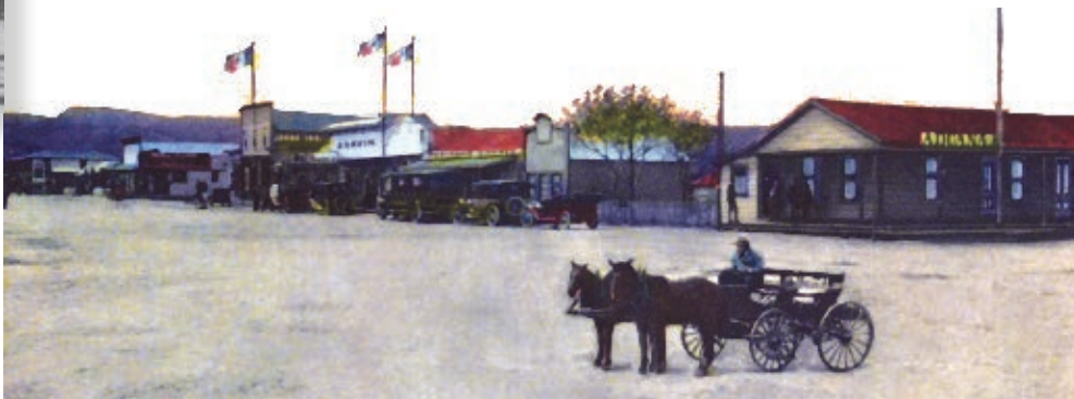
Aduana de Tijuana, 1889.

Uno de los objetivos al establecer la aduana en Tijuana fue controlar el ingreso de mercancías de San Diego, California, a territorio mexicano. Los altos cobros de impuestos causaron inconformidad, por lo que se incrementó el comercio en la aduana marítima de Ensenada de Todos Santos.