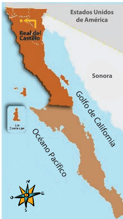
Ubicación de Real del Castillo.

Se importaban alimentos básicos, como harina, frutas, verduras, o más elaborados, como productos enlatados y en conserva, telas, ropa, café y tabaco.