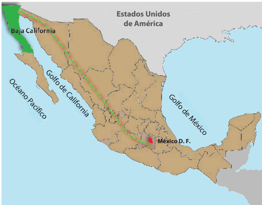
Mapa de la localización del Partido Norte.

Observa la distancia que hay entre el Partido Norte y el centro sur del país, y comenta con tus compañeros acerca de los posibles problemas de comunicación y transporte que había en esa época.