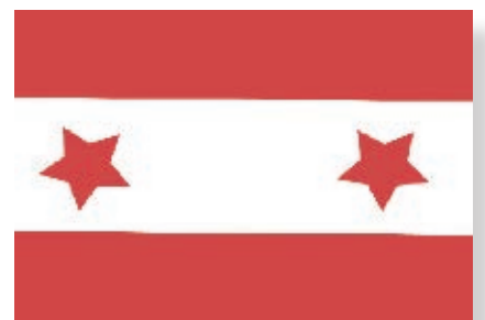
Bandera de la República de Baja California y Sonora, la cual ostentaba dos estrellas: una por Baja California y otra por Sonora.