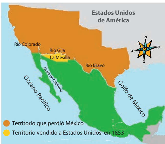
Mapa del territorio perdido después de la invasión de Estados Unidos en 1846.

En 1846, Estados Unidos invadió México provocando una guerra. Al término de ésta, México perdió más de la mitad de su territorio, lo que ocasionó que los gobernantes del país, por varios periodos, buscaran proteger las entidades del norte de México de posibles invasiones por parte de Estados Unidos.