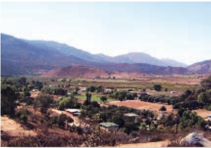
La Grulla, Baja California, en la actualidad.