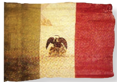
Bandera mexicana 1846-1848.