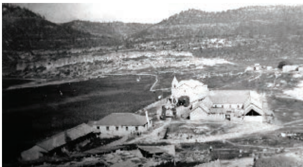
Sisoguichi, Bocoyna, en el siglo XIX.

➡ Observa las fotografías del medio rural y urbano en algunos municipios del estado. Comenta con tus compañeros cómo eran antes y cómo son ahora.