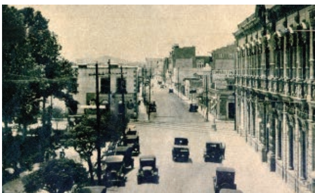
Ciudad de Chihuahua en el siglo XX.