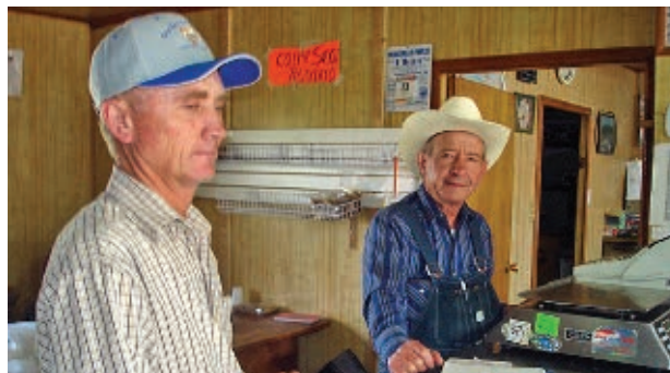
Menonitas en quesería, municipio de Cuauhtémoc.

El grupo menonita es originario de Alemania y Holanda. Llegó a Chihuahua en 1922 y se estableció en los municipios de Cuauhtémoc y Casas Grandes.