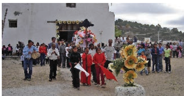
Festividad religiosa pima.

Los guarijíos se hacen llamar macuragwe , que significa “los que agarraron la tierra”. Actualmente se localizan en poblados de los municipios de Chínipas y Uruachi.