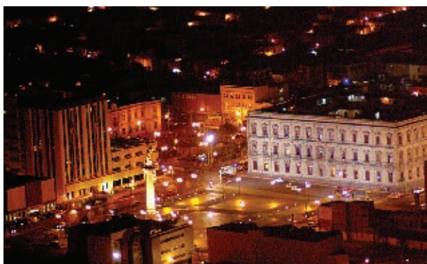
Ciudad de Chihuahua, en la actualidad.

De acuerdo con el Instituto Nacional de Estadística y Geografía, Inegi, una población es rural cuando tiene menos de 2 500 habitantes; y es urbana cuando tiene más de 2 500 personas.