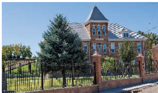
Academia Juárez, municipio de Nuevo Casas Grandes.

El grupo menonita es originario de Alemania y Holanda. Llegó a Chihuahua en 1922 y se estableció en los municipios de Cuauhtémoc y Casas Grandes.