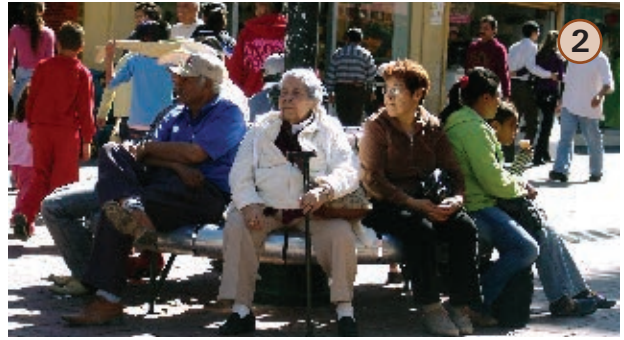
Gente en la plaza.