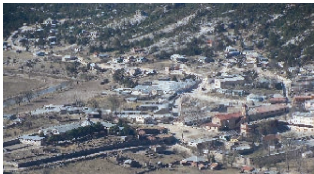
Sisoguichi, Bocoyna, en la actualidad.