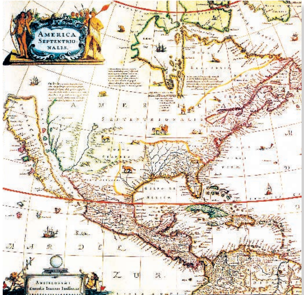
Mapa de América del Norte elaborado por el holandés Jan Jansson, en 1638.

Después, otros expedicionarios, como Francisco de Ulloa, Juan Rodríguez Cabrillo y Sebastián Vizcaíno navegaron por el océano Pacífico. Aunque no establecieron poblados, trazaron mapas y le dieron nombre a algunos lugares.