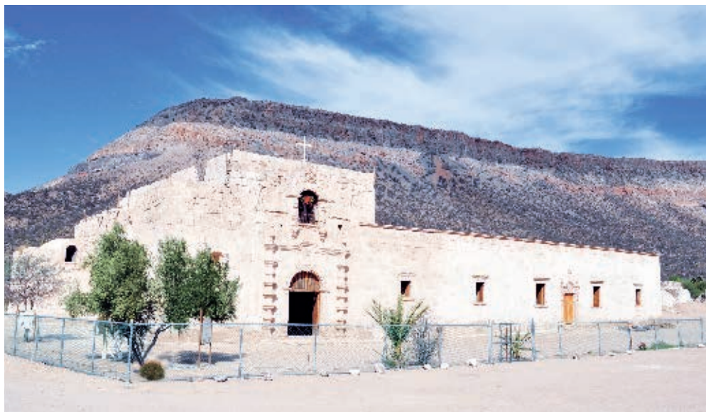
Misión de San Francisco de Borja fundada en 1762 por el padre jesuita Wenceslao Link. En 1801, los dominicos contruyeron el edificio de piedra.

La orden de los dominicos llegó en 1773, y desde esa fecha hasta 1849 trabajó con los indígenas que habitaron lo que hoy es Baja California. Fundaron ocho misiones: San Miguel, Nuestra Señora de Guadalupe, Santo Tomás, Santa Catarina, San Vicente Ferrer, Santo Domingo, San Pedro Mártir y Nuestra Señora del Santísimo Rosario.