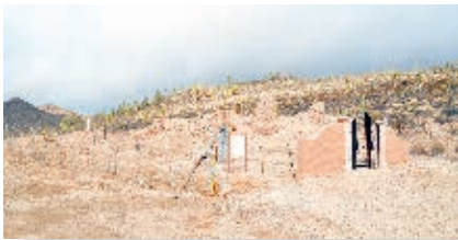
Misión franciscana San Fernando Rey de España de Velicatá, fundada en 1769 por fray Junípero Serra.