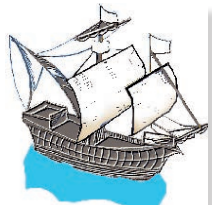
Modelo de galeón utilizado en el siglo XVI.

Hernán Cortés, Pedro de Alvarado, Nuño de Guzmán y Antonio de Mendoza, entre otros españoles, se interesaron y pelearon el derecho de buscar y explotar los tesoros de los que habían oído hablar en la supuesta isla de California.