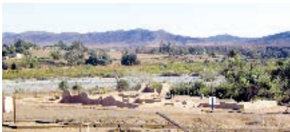
Misión de San Vicente Ferrer, fundada en 1780 por los padres dominicos Miguel Hidalgo y Joaquín Valero.

Los primeros en establecerse fueron los jesuitas en 1697, quienes fundaron varias misiones en el sur y tres en el estado: Santa Gertrudis la Magna, San Francisco Borja y Santa María de los Ángeles. Los jesuitas fueron expulsados en 1767 de todo el territorio de España y de sus dominios en América, debido a problemas políticos y rumores que llegaron al rey sobre el trabajo que realizaban en las misiones. Llegar a la península era complicado, por lo que la noticia y expulsión de los jesuitas se conoció un año después.