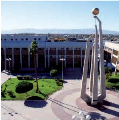
Plaza de los Tres Poderes.

Ahora, revisarás información de los cinco municipios de nuestro estado, y conocerás algunas características de la población.