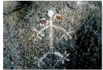
Detalle de pintura rupestre del resguardo del "Indio", El Vallecito.

La ciudad se fundó el 2 de abril de 1888.