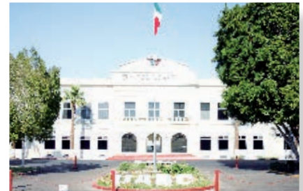
Rectoría UABC, Mexicali.