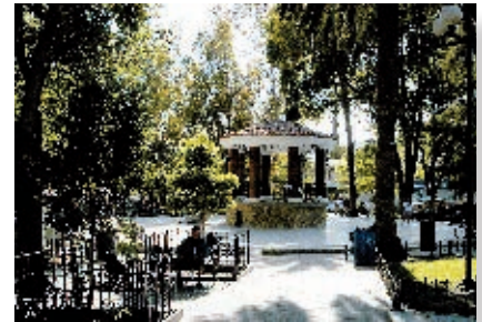
Parque Miguel Hidalgo.