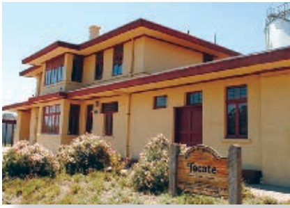
La estación de ferrocarril fue construida en 1919 y es uno de los edificios más antiguos de la ciudad.