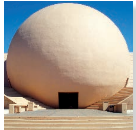
Centro Cultural Tijuana (Cecut).

Una garita es una oficina de aduana en la frontera.