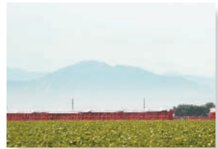
Valle de Mexicali.

Es importante saber que el Alto Golfo y Delta del Río Colorado fueron declarados Reserva de la Biosfera en 1993. Ésta fue una medida para proteger a la totoaba y a la vaquita marina o cochinito, fauna que sólo existe en este lugar del mundo y que está en peligro de extinción.