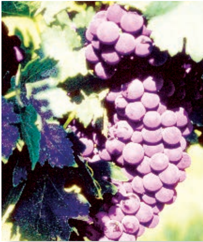
La vid fue plantada y cultivada en la península por los misioneros.