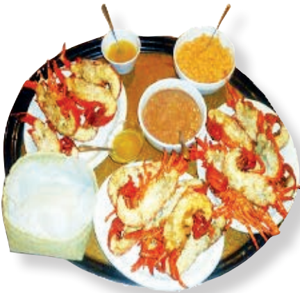
Langosta preparada al estilo Puerto Nuevo.

Es el municipio de más reciente creación en la entidad. Antes era delegación de Tijuana, pero desde 1995 se constituyó como municipio.