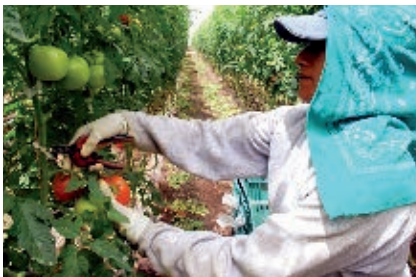
El valle de San Quintín es reconocido a nivel nacional como uno de los principales productores de tomate y fresa.