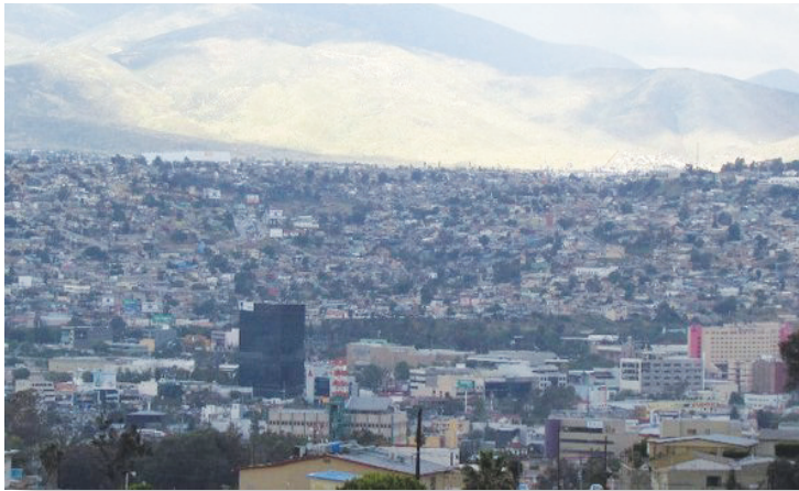
Vista panorámica de Tijuana.

Tijuana es la ciudad más poblada del estado, porque llega gente de otros estados de la república y de diversos países.