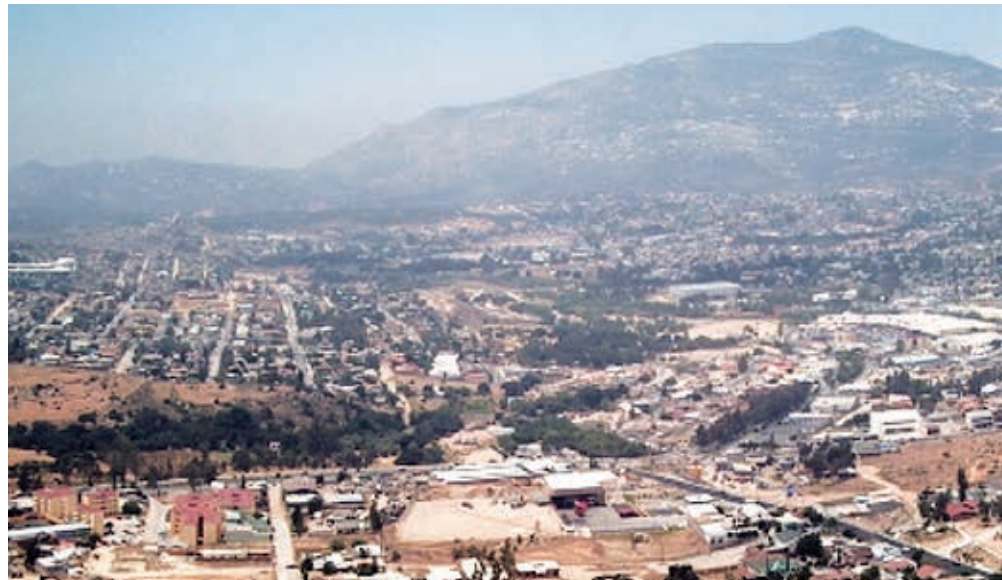
Vista panorámica de Tecate.

La actividad económica fundamental es la industria maquiladora, la cervecera y, en menor grado, la agricultura, la artesanía y el turismo.