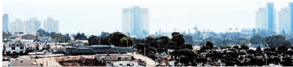
Vista panorámica de Playas de Rosarito.

El nombre El Rosario data desde la época misional, cuando en este sitio se localizaba la ranchería Wa-kuatay, habitada por los kumiai. Para diferenciarlo de un sitio misional al sur de la entidad también llamado El Rosario, le empezaron a llamar Rosarito. Posteriormente lo nombraron Playas de Rosarito.