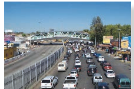
Garita de Tijuana.