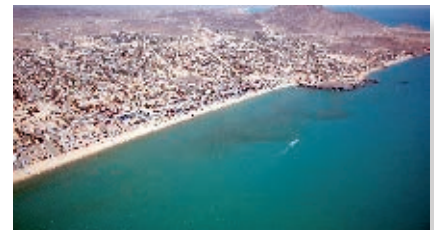
Bahía de San Felipe.