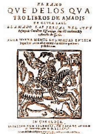
La primera edición de Las sergas de Esplandián fue publicada en Sevilla, en junio de 1510.