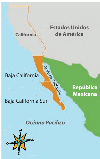
Mapa de las Californias.

Cuando llegaron los misioneros franciscanos, tiempo después que los jesuitas, se establecieron al norte de la península y llamaron a esa región Alta o Nueva California, que hoy pertenece a Estados Unidos; mientras que a la parte sur la llamaron Antigua o Baja California.