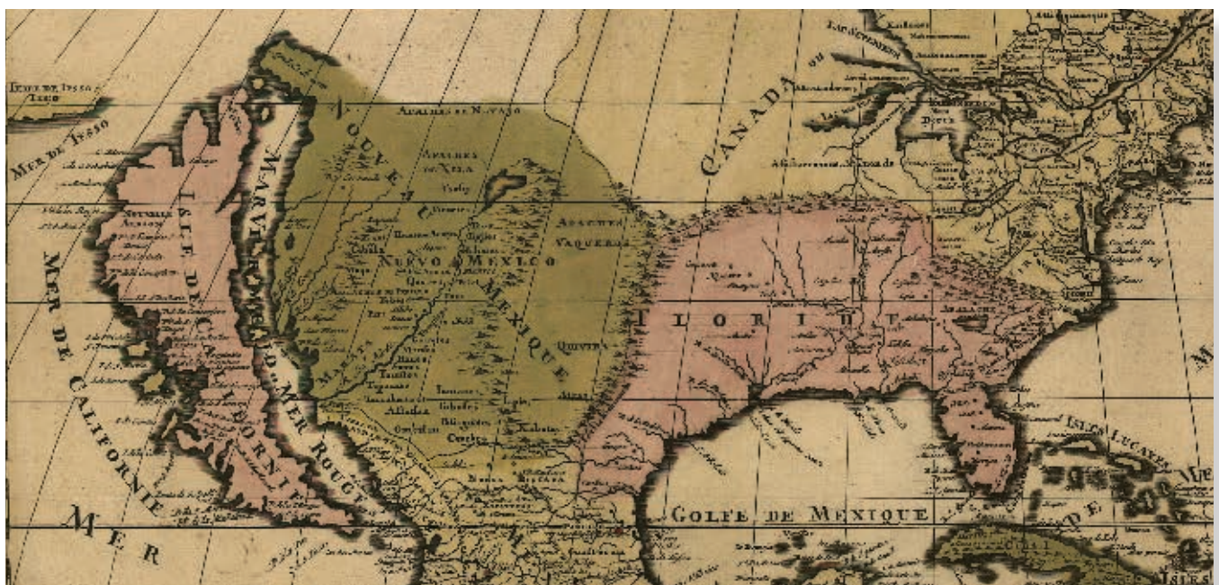
América septentrional dividida en sus principales partes, 1694.

¿cómo te imaginas que los españoles descubrieron que California en realidad es una península?