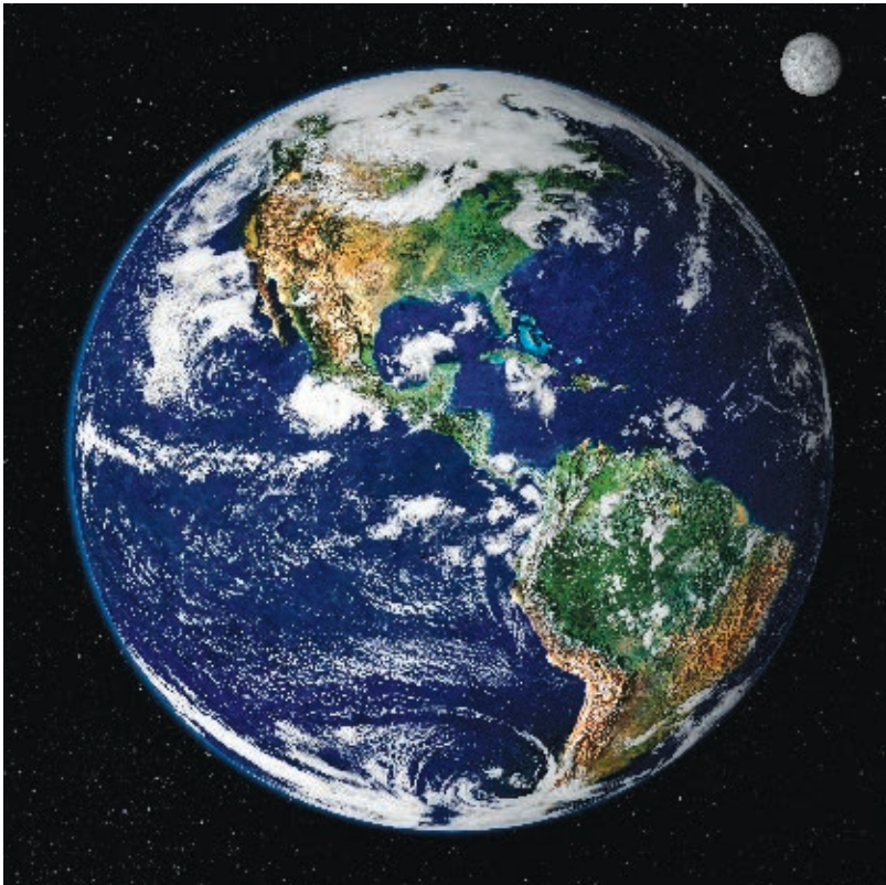
Imagen satelital de la Tierra.

Si no identifican alguno, su maestro se los proporcionará o los apoyará para localizarlos en alguno de los otros grupos. Después, contesten las preguntas.