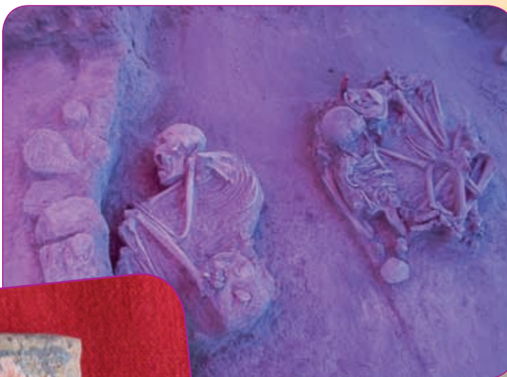
Enterramiento encontrado en El Ocote.