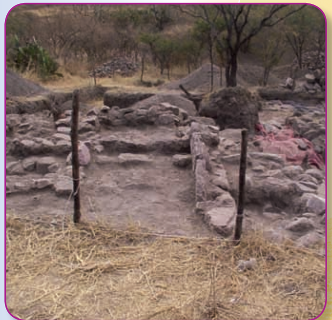
Sitio arqueológico El Ocote.

En grupo , reflexionen acerca de la importancia del lugar y entre todos elaboren una conclusión.