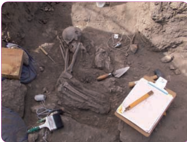
Enterramiento encontrado en El Ocote.

Ofrendas: objetos que simbolizan respeto por los dioses.