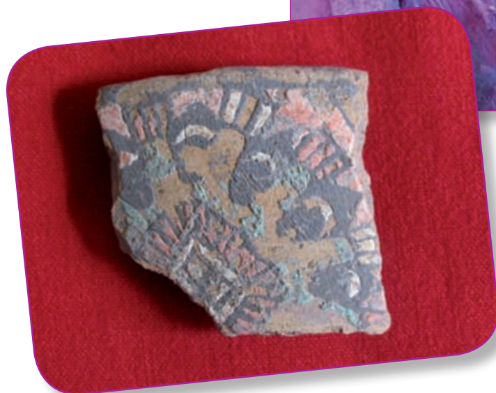
Fragmento de vasija de barro o "tepalcate".