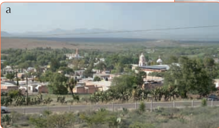
a) Real de Asientos. b) Jesús María.

Formen equipos , escojan una región de Aguascalientes. Calquen el mapa de los municipios que pertenecen a cada región. Consigan recortes o dibujen los productos que distinguen a cada una. Con el mapa, preparen una exposición frente al grupo.