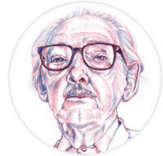
La hija de los danzantes, Manuel Álvarez Bravo.