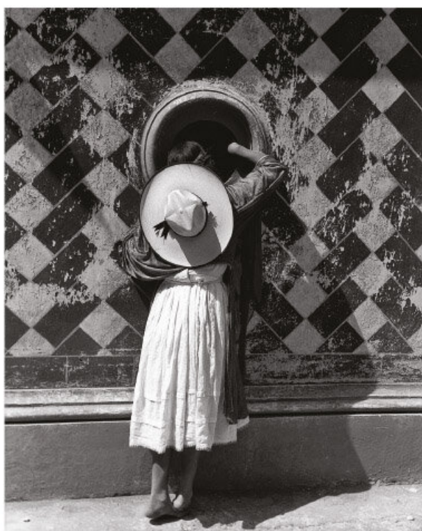
La hija de los danzantes