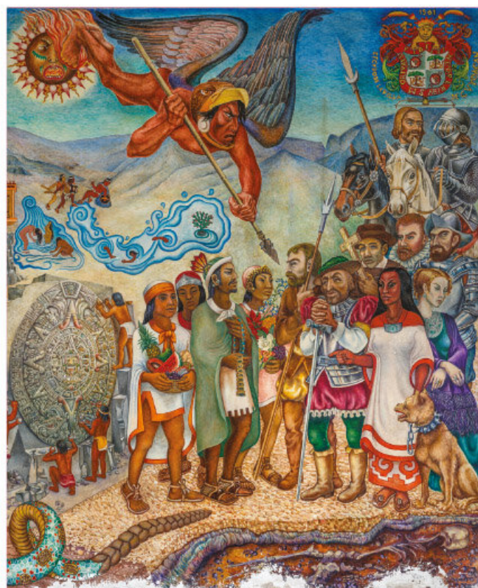
El primer encuentro