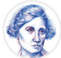
Elvia Carrillo Puerto