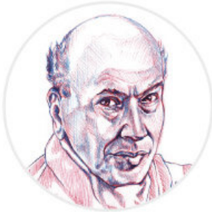
Casa de Luis Barragán, Luis Barragán.