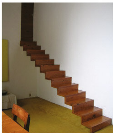
Casa de Luis Barragán