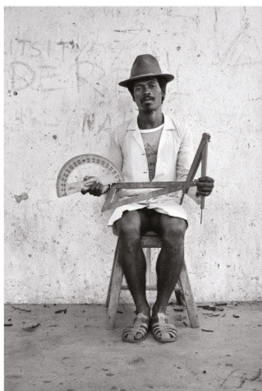
El maestro de geometría