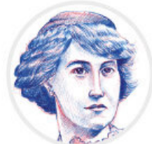
Carmen Serdán Alatristero