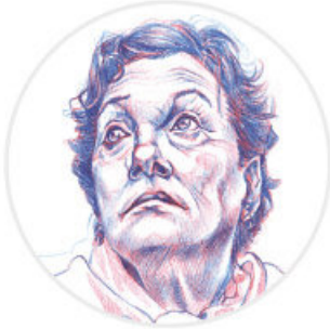
El maestro de geometría, Graciela Iturbide.