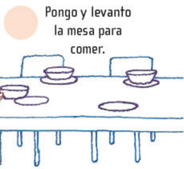
Pongo y levanto la mesa para comer.