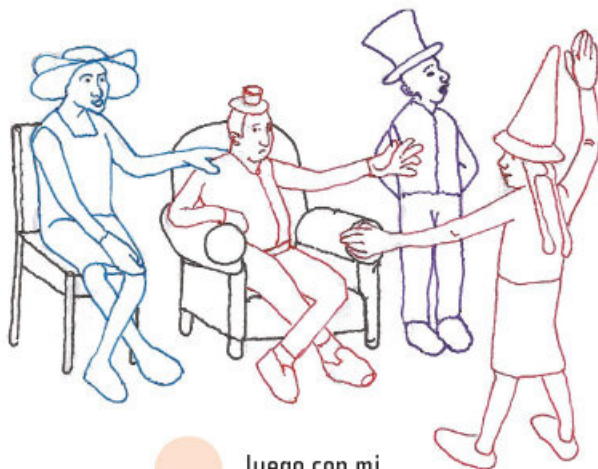
Juego con mi familia.