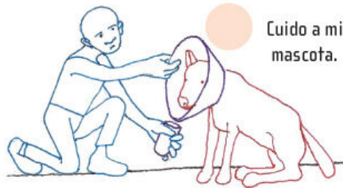
Cuido a mi mascota.