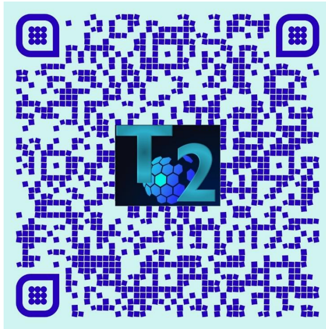
Plantilla para trazo de base

Empieza con la elaboración de los cortes y dobleces del cartón previamente marcado con todos los trazos, tal como lo concretamos en la sesión anterior, para el armado del empaque.