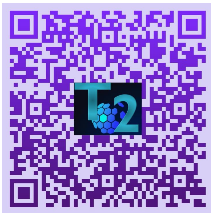
Plantilla para trazo de empaque

Necesitarás la plantilla que realizaste en el cartón Caple la sesión anterior. Si todavía no tienes tu plantilla, te invitamos a que la realices.