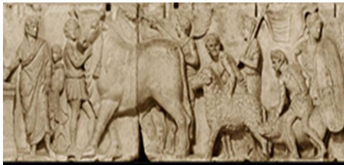
Foto Detalle animales friso Souvetaurilia .