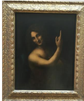
Pintura 7 San Juan Bautista de Leonardo da Vinci, 1513-1516

Observa que el joven se está riendo en la pintura y está señalando hacia arriba.