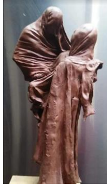
Escultura 6 Sin título I, Adrich Mo, 2015

Observa que en esta escultura parece que un cuerpo sale del otro, o más bien, como si lo absorbiera.