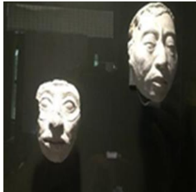
Cabezas mayas II