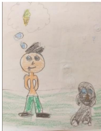
Santi, Ciudad de México