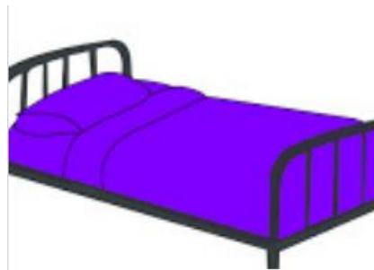
FINALLY, PUT THE BEDSPREAD ON THE BED

You can also think about what other illustrated guides would be useful in your house. - También puedes pensar en qué otras guías ilustradas podrían ser útiles en tu casa.