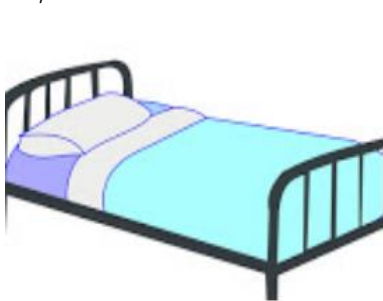
AFTER THAT, PUT CLEAN SHEETS