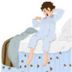
FIRST, WAKE UP IN THE MORNIG

This is our illustrated guide to make the bed. You can do yours and keep it in mind when your parents ask you to make your bed. - Esta es nuestra guía ilustrada para tender la cama, puedes hacer la tuya y mantenerla presente cuando tu mamá o papá te pidan que tiendas tu cama.