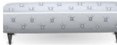
THEN, TAKE ALL THE BLANKETS AND