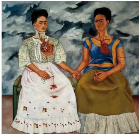
Cuadro de las 2 Fridas.

En esta primera pintura, que se titula “Las dos Fridas”, vemos a dos mujeres que aparentemente son la misma, pero si eres cauteloso, puedes observar que tienen elementos que las distinguen, tanto en la ropa como en los elementos que se ven en la Frida que está vestida de blanco. El rostro en ambas es serio y llama la atención el corazón. Yo siento que transmite pesadumbre y desaliento.