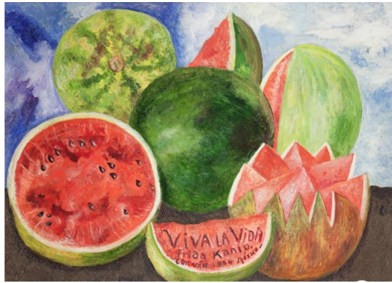
Viva la Vida. Renacimiento.

Por último, te muestro la obra titulada “Viva la vida”. En ella ves sandías completas e incompletas, pero lo que particularmente atrapa tu atención es el mensaje antes de la firma de Frida, “Viva la Vida”.