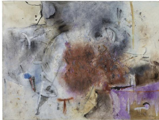
Lilia Carrillo, Símbolos actuales , 1968. Artista mexicana.