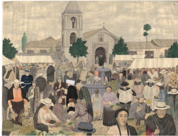
Alfonso Ramírez Fajardo, Fiesta , 1942. Pintor colombiano.

Imágenes de indios en sus faenas y de campesinos en las ciudades, retratos clásicos y escenas de flores y paisaje al mejor estilo de Monet; o incluso bodegones abstractos y noches surrealistas.