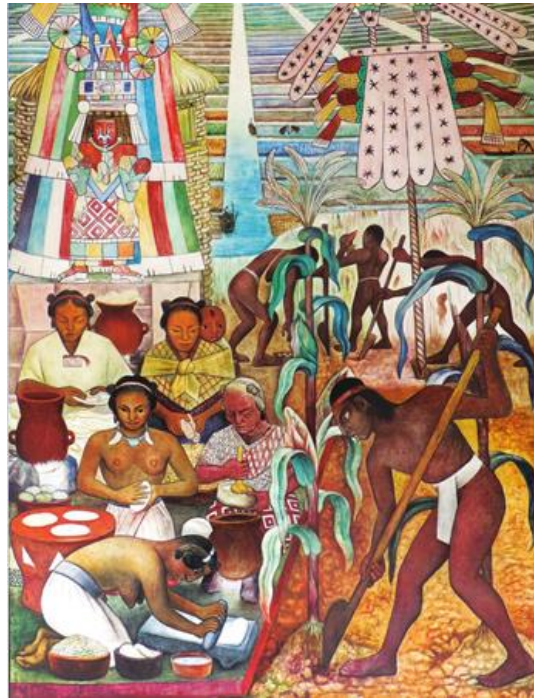
Diego Rivera, La cultura huasteca , mural en Palacio Nacional, 1950.

La ambigüedad estética del continente encontraba su razón, claramente, en la dispersión de su posición en el conflicto bipolar.