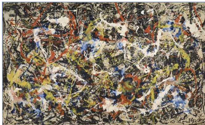
Jackson Pollock, Convergencia , 1952

Como leíste en el texto de la investigadora Marcela Villa, el arte no era un tema secundario durante la Guerra Fría, era una de las herramientas de propaganda política más importantes pues resaltaba los aspectos ideológicos del régimen y que eran difundidos en el resto del mundo, presentando al capitalismo y al socialismo como los únicos modelos posibles de organización social y económica. Ahora se compartirá contigo la siguiente obra. Es un Pollock o así dirían los conocedores.