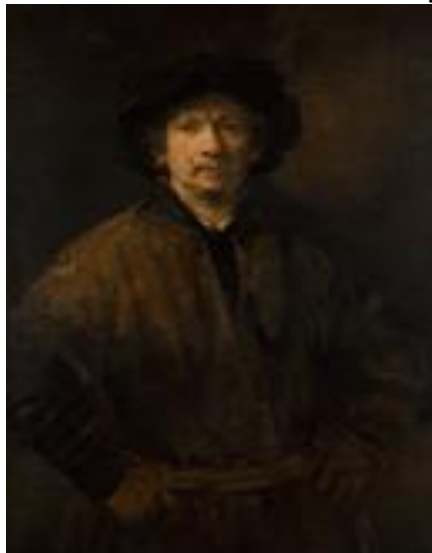
Autorretrato de Rembrandt van Rijn, 1655