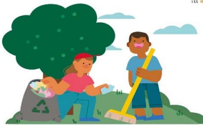
3. Lean la segunda historia en voz alta:

Por iniciativa de niñas, niños y su maestro, en una escuela primaria de Tierra Blanca, Veracruz, la comunidad escolar se organizó en un comité ciudadano para recolectar productos de plástico de Polietileno Tereftalato (PET), como botellas y envases, y de polietileno de Alta Densidad (PEAD), como tubos de drenaje, bolsas y utensilios de cocina. Para constituir su comité, el director, las maestras y representantes de madres y padres de familia se organizaron. Luego, se reunieron con los alumnos de cada grupo y sus familiares, para hacerlos conscientes de la gravedad de usar y desechar en cualquier lugar esos productos; les explicaron que esto daña el medio ambiente y pone en serio peligro al planeta.