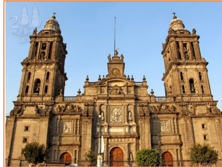
Ciudad de México.

Para que continúes conociendo lugares que fueron construidos durante el periodo virreinal y con características del arte arquitectónico barroco, observa las siguientes imágenes, en casa identifica algunas construcciones que se encuentran en la ciudad donde vives.