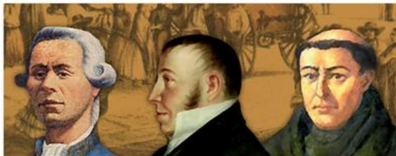
Francisco Primo de Verdad Francisco Azcárate y Lezama Melchor de Talamantes