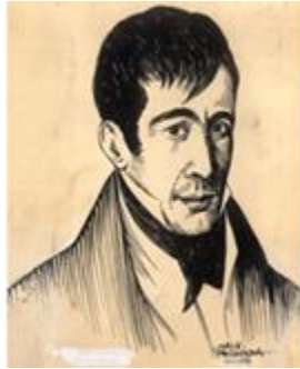
Súper: José Joaquín Fernández de Lizardi

Y en última, el eje principal para la incorporación de las ideas ilustradas fue la instrucción pública. De modo tal que, ésta fue la principal preocupación de los ilustrados. Muchos hombres ilustrados no cesaron en alcanzar su ideal de emancipación intelectual y por sacar de los lóbregos túneles de la ignorancia a la población. Para ello, se valieron de todos los recursos disponibles en la época, por ejemplo, la construcción de escuelas, la formación de maestros, el teatro, o la circulación de diarios, como el Pensador Mexicano de José Joaquín Fernández de Lizardi.