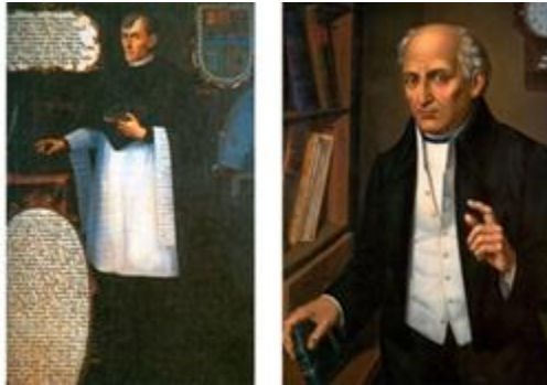
Súper: José Antonio Alzate y Miguel Hidalgo y Costilla

Aunque el efecto modernizador de las Reformas Borbónicas centró el poder en la Corona y trajo consigo mayores índices de opresión, también introdujo las innovaciones intelectuales que se estaban gestando en Europa. Lo que provocó que los sentimientos nacionalistas de los criollos se exacerbaban y encabezaran el descontento ante las medidas que habían sido implementadas por la Corona española.