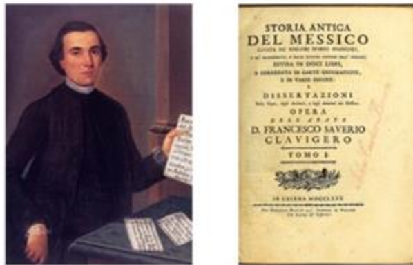
Francisco Javier Clavijero, Historia Antigua de México, 1780.

El principal representante de este movimiento fue Francisco Javier Clavijero, considerado uno de los hombres más brillantes del siglo XVIII. En 1767, el rey Carlos III decretó la expulsión de la Compañía de Jesús de los territorios novohispanos. Clavijero partió hacia Italia, en donde vivió en Ferrara y Bolonia. Desde el destierro escribió su obra más importante, Historia Antigua de México, donde incorpora las “Disertaciones” una declaración abierta de indignación en contra de los europeos que calumniaban a los americanos.