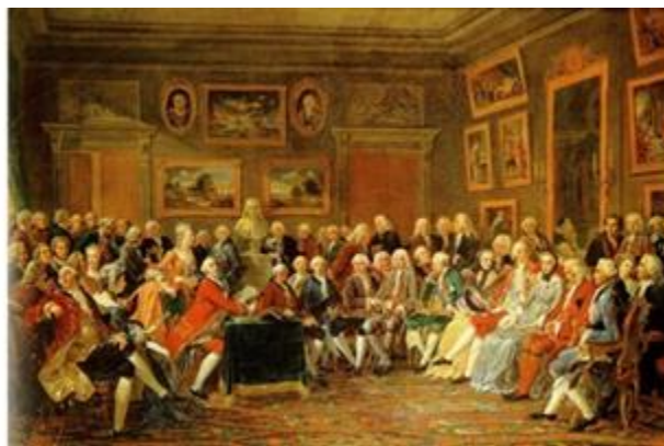
Lectura de la tragedia "El huérfano de la China" de Voltaire en el salón de madame, Geoffrin, 1812.

Estos pensadores buscaron difundir sus ideas a través del debate y la escritura. Publicaron detalladas definiciones o tratados sobre economía, política y la naturaleza del conocimiento, así como novelas y crónicas de viaje. Así, el pensamiento de la Ilustración se difundió en Europa y en sus posesiones coloniales.