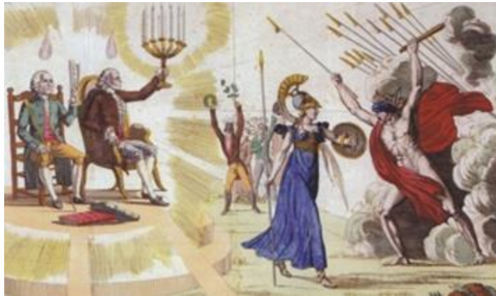
Caricatura. Minerva protege Jean-Jacques Rousseau y Voltaire contra el fanatismo.

Los ilustrados estaban convencidos de que todos los hombres estaban dotados de razón y tenían derechos naturales a la vida y a la libertad, fueron muy críticos de la jerarquía estamentaria, que consideraban injusta. Aunque estos conformaban una minoría privilegiada dentro de sociedades mayoritariamente rurales, pobres e iletradas, los ilustrados insistían en que lo que importaba era la inteligencia y el desempeño, no el origen. Esto representó un cambio profundo en la forma de pensar a la sociedad y, por lo tanto, en el papel que debían desempeñar dentro de ella los individuos. La crítica a los privilegios de ciertas clases les resultaba atractiva a muchos burgueses, quienes a pesar de su talento y, en algunos casos, de su riqueza, eran excluidos de los círculos más cercanos al poder.