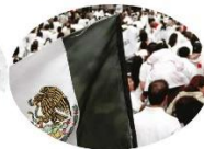
En 2006, la sociedad civil se movilizó a favor de la paz.