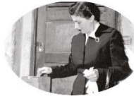
Las mujeres mexicanas votaron por primera vez el 3 de julio de 1955 para elegir diputados.

1. Observa las imágenes. Reflexiona: ¿cómo ha cambiado la democracia en nuestro país a lo largo de la historia?