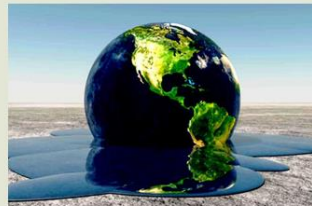
Representación del calentamiento global

Ante la falta de precipitaciones, se secaron las presas que suministran el agua a las casas, lo que también afecta al campo y a quienes se dedican al cultivo.