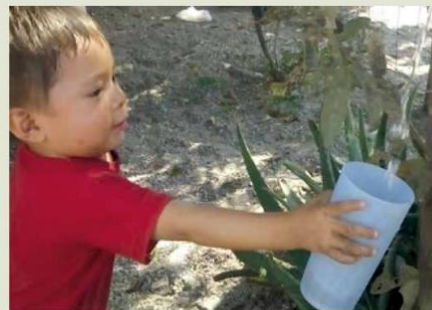
El agua ha sido escasa en la colonia Los Girasoles

8 de julio de 2021. El pasado 2 de julio, vecinos de la colonia Los Girasoles se quejaron porque el agua potable que llega a sus casas es muy poca. A la semana, únicamente dos o tres días cae el agua y apenas un chorrillo. Personal del gobierno fue a informar sobre la falta de lluvias y la escasez de agua y dieron algunas recomendaciones, como reutilizar el agua, cerrar las llaves al enjabonarse o lavarse los dientes, así como reparar o reportar fugas.