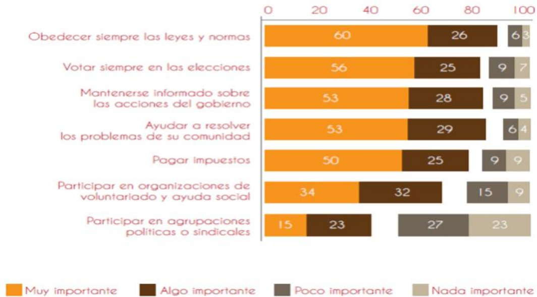
Figura 1—¿Qué hace a un buen ciudadano (en México)?

Ahora toma la nota Diana, que da la siguiente información: