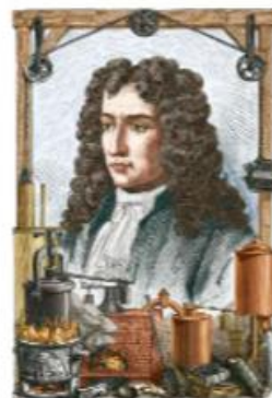
Denis Papin (1647-1712)

En el año 75 a. C., Herón de Alejandría inventó un dispositivo que se llenaba de agua y al calentarlo el vapor salía por unas aberturas, lo que lo hacía girar. Sin embargo, fue apenas en el año 1700 cuando se le dio una aplicación práctica al vapor. Denis Papin, físico francés, inventó la marmita –una especie de olla exprés– y un motor de vapor que usó para movilizar un barco. A medida que el ser humano incrementó sus conocimientos y mejoró la tecnología, sustituyó las máquinas de vapor por motores que usan gasolina y electricidad. ■■■