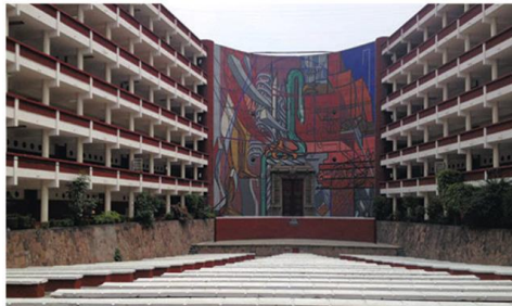
Benemérita Escuela Nacional de Maestros Teatro al aire libre "Lauro Aguirre" con mural de José Clemente Orozco

Con la pandemia, ni pensar en hacer una encuesta más que a la distancia. Observa la gráfica siguiente y aplica lo que ya en clases anteriores has aprendido e interprétalas.