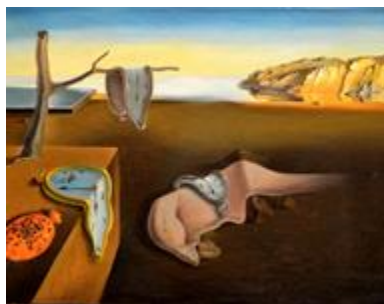
La persistencia de la memoria de Salvador Dalí, 1931

Observa la siguiente obra se trata de “La persistencia de la memoria” o “Relojes blandos o derretidos”, de Salvador Dalí.