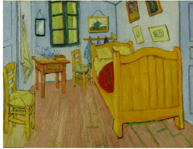
Pintura Dormitorio de Arlés o Habitación de Vincent van Gogh, 1888

La pintura se titula “Dormitorio de Arlés” también se le conoce como “Habitación” o “La recámara”. Es una obra de Vincent van Gogh.