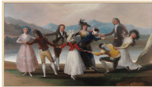
La Gallina ciega de Francisco de Goya 1789; Fuente: https://www.traveler.es/experiencias/articulos/viaje-a-un-cuadro-la-gallina-ciega-de-francisco-de-goya/17856

Se observan personas, montañas, un lago, un árbol, pasto, el cielo. ¿Cómo son las personas que observas?