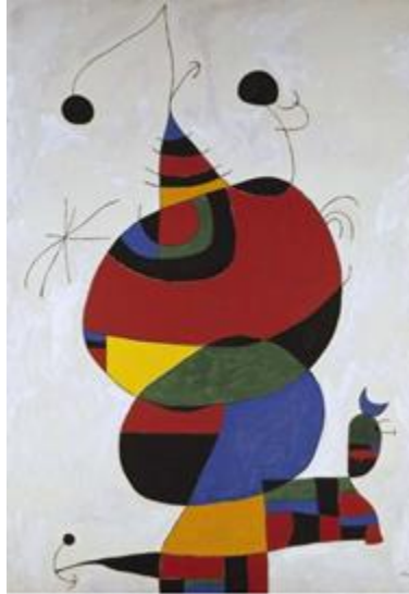
Femme, oiseau, étoile de Joan Miró [Mujer, pájaro, estrella] 1966-1973