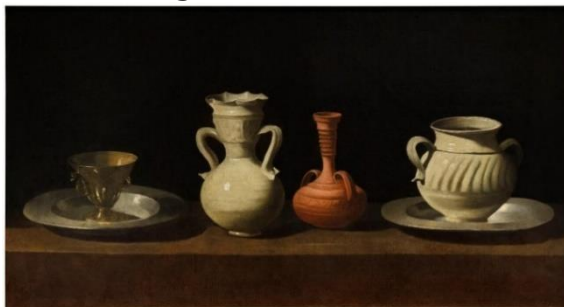
Bodegón de cacharros.

Se titula Bodegón con cacharros de Francisco de Zurbarán que pintó por allá de los años 1650. Esta obra se encuentra en el Museo Nacional del Prado.