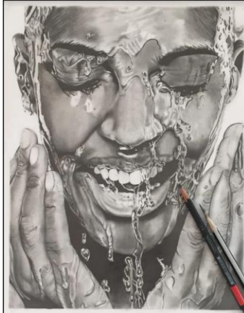
Mujer y agua