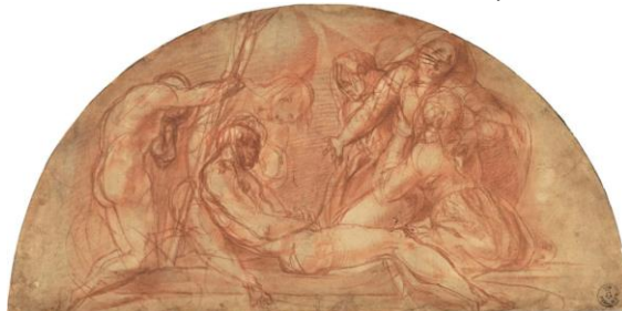
Estudio para el entierro de Cristo de Jacopo Pontorno, c. 1525

A continuación, tenemos al pintor Jacopo Pontorno en Estudio para el entierro de Cristo . Sanguina sobre papel blanco. Como habíamos mencionado, antes de realizar una pintura hacían sus bocetos, también llamados estudios.