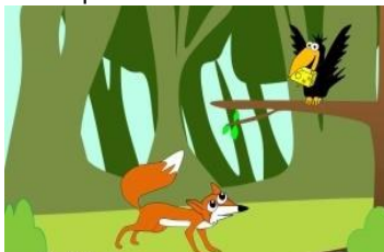
La del zorro y el cuervo.

Las fábulas siempre traen una moraleja, que es el mensaje o enseñanza que desean transmitir, ¿Cuál es la última fábula que leíste?