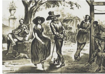
Son tradicional veracruzano.

Me dicen la vida mía no nos vaya a suceder, como los que se querían, como los que se querían y ahora no se pueden ver y ahora no se pueden ver.