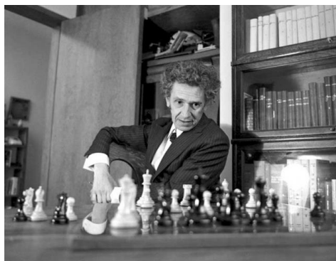
Juan José Arreola (1918-2001)

Realiza la lectura del texto literario de Juan José Arreola.