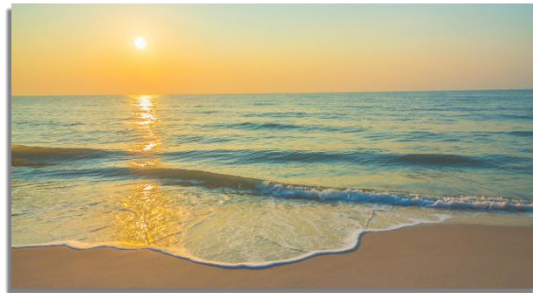
Autor e intérprete: Fernando Delgadillo. Álbum: Entre pairos y derivas . 1998.

Te he venido suponiendo en todos los días que me faltan tal cual si pudiera verlos como son, sólo quiero resumirte que al principio te pensaba y que hoy contemplo en ti la costa a donde voy [...].