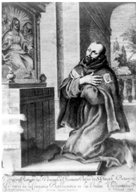
Fray Pedro de San José Betancourt, grabado Colección Culhuacán - Fototeca Nacional Fototeca Nacional INAH

https://www.mediateca.inah.gob.mx/islandora_74/islandora/object/fotografia%3A401015