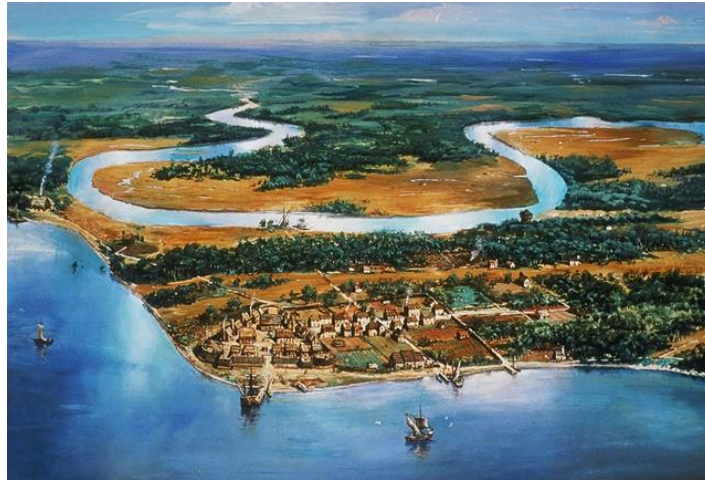
Jamestown en el siglo XVII. https://destinoinfinito.com/jamestown/

Mientras tanto, en lo que hoy es Estados Unidos, se fundó el asentamiento de Jamestown, en la actual Virginia. Fue la primera comunidad permanente inglesa en América del norte y la fundadora de lo que serían las 13 colonias.