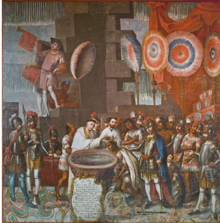
Bautizo de la nobleza tlaxcalteca

Precisamente en esta labor evangelizadora es que destacamos el rescate de la lengua de los naturales y las nociones más tempranas que se sabe sobre la forma de vida en Mesoamérica.