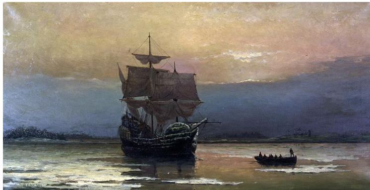
De William Halsall - Pilgrim Hall Museum, Dominio público: https://commons.wikimedia.org/w/index.php?curid=308115

En 1620 llegó otro grupo de migrantes de religión protestante a las costas de lo que sería Nueva Inglaterra, a bordo del barco Mayflower.