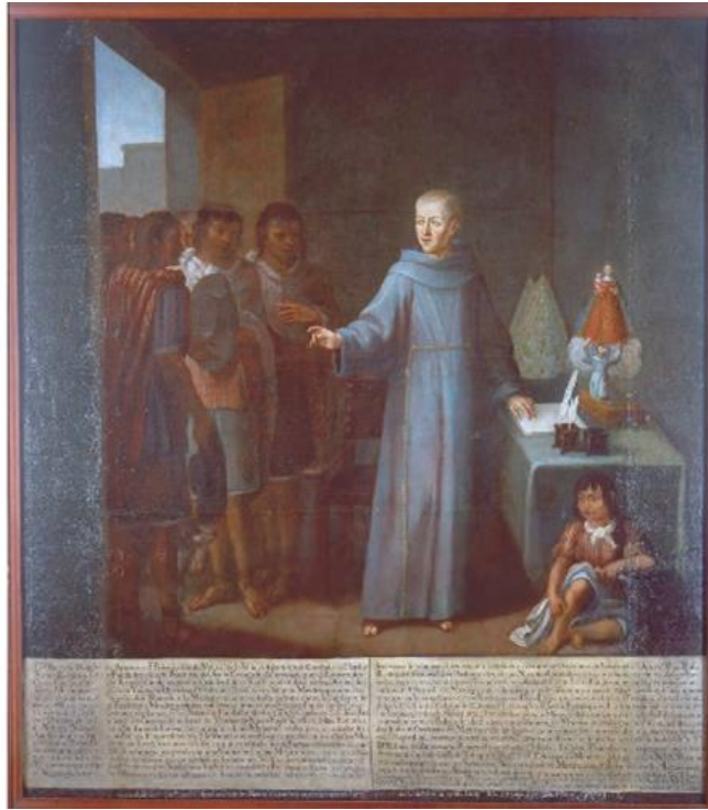
Fray Pedro de Gante Pintura de caballete Óleo sobre tela

adoración de los demonios, la hubiera ahora de Jesucristo y veneración de los santos”.