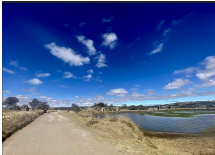
Vista de Tlaxcala. Lluís Emiliano Fuentes.

El alumno Lluís Emiliano Fuentes viajó a un lugar apartado del estado de Tlaxcala, y se encontró con este paisaje. Como él es muy aficionado a la fotografía, lo retrató y lo comparte: