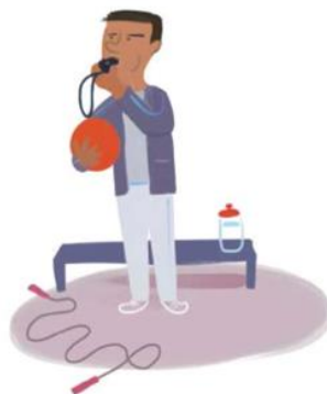
Una de sus responsabilidades es...

Director o directora, una de sus responsabilidades es: Mantener el orden en la escuela para que todos estén seguros.