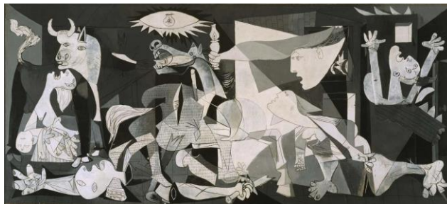
Guernica de Pablo Picasso, 1937

La obra que veras de él es el mural Guernica de 1937, Pablo Picasso representó una escena trágica de la Guerra Civil española, aquí podemos observar que utilizó los colores neutros: el blanco, el negro y una variada gama de grises.