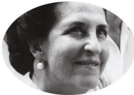
En 1979, la maestra y feminista Griselda Álvarez fue electa gobernadora de Colima. Fue la primera mujer en ocupar este cargo.