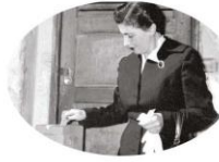
Las mujeres mexicanas votaron por primera vez el 7 de julio de 1955 para elegir diputados.

1. Observen las imágenes. Reflexionen: ¿cómo ha cambiado la democracia en nuestro país a lo largo de la historia ?