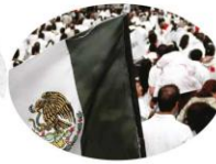
En 1908, la sociedad civil se movilizó a favor de la paz.