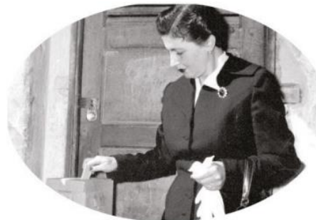
Las mujeres mexicanas votaron por primera vez el 3 de julio de 1955 para elegir diputados.