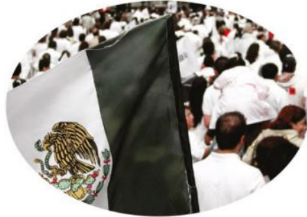
En 2008, la sociedad civil se movilizó a favor de la paz.

En 2008 la sociedad civil se movilizó a favor de la paz.