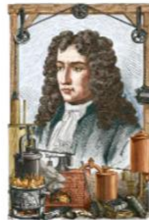
Denis Papin (1647-1712).

En el año 75 a. C., Herón de Alejandría inventó un dispositivo que se llenaba de agua y al calentarlo el vapor salía por unas aberturas, lo que lo hacía girar. Sin embargo, fue apenas en el año 1700 cuando se le dio una aplicación práctica al vapor. Denis Papin, físico francés, inventó la marmita –una especie de olla exprés– y un motor de vapor que usó para movilizar un barco. A medida que el ser humano incrementó sus conocimientos y mejoró la tecnología, sustituyó las máquinas de vapor por motores que usan gasolina y electricidad. ■■■