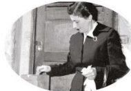
Las mujeres mexicanas votaron por primera vez el 3 de julio de 1955 para elegir diputados.

1. Observa las imágenes. Reflexiona: ¿cómo ha cambiado la democracia en nuestro país a lo largo de la historia?