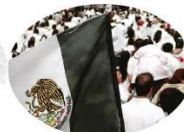
En 2006, la sociedad civil se movilizó a favor de la paz.