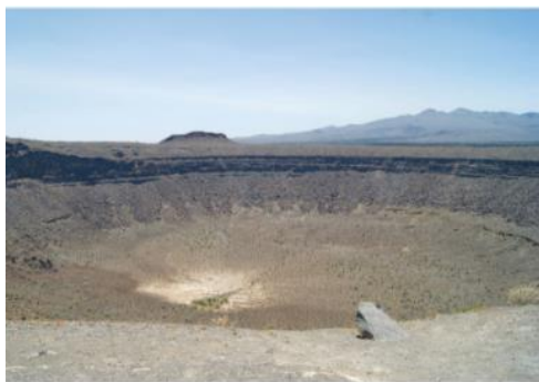
Reserva de la Biosfera El Pinacate y Gran Desierto de Altar, Sonora