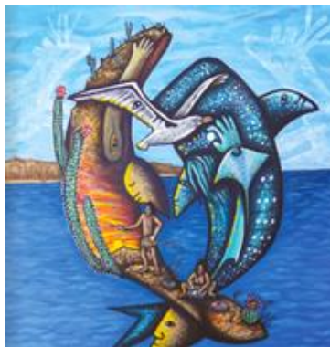
Encuentro entre mar y desierto de Ulises Martínez, 2020

Veamos la siguiente pintura: Encuentro entre mar y desierto del muralista oaxaqueño Ulises Martínez.