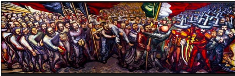
Del porfirismo a la revolución de David Alfaro Siqueiros (1957-1966)

Ahora tenemos más elementos para apreciar el color en las obras, por último, vamos a mirar la siguiente obra: