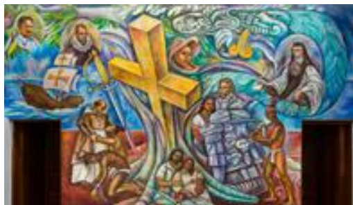
Encuentro de dos culturas o El Mestizaje de Raúl Anguiano (1993)