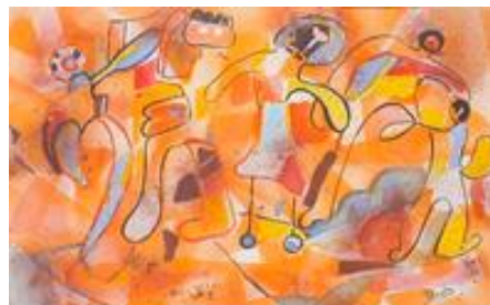
"JUEGOS INFANTILES" Herminia Pavón, 2009

Observemos esta obra se titula Juegos infantiles y es de la artista mexicana Herminia Pavón, ¿Qué colores puedes observar? ¿Son cálidos o fríos? ¿Qué sensación nos da esta pintura?