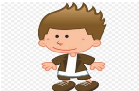
Hermano de 2 años.

https://www.klipartz.com/es/sticker-png-oytlz