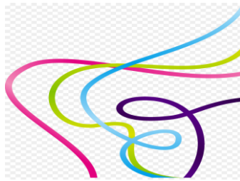
Trayectoria en todas direcciones.

Trayectoria en todas direcciones: hermanito porque es muy curioso.