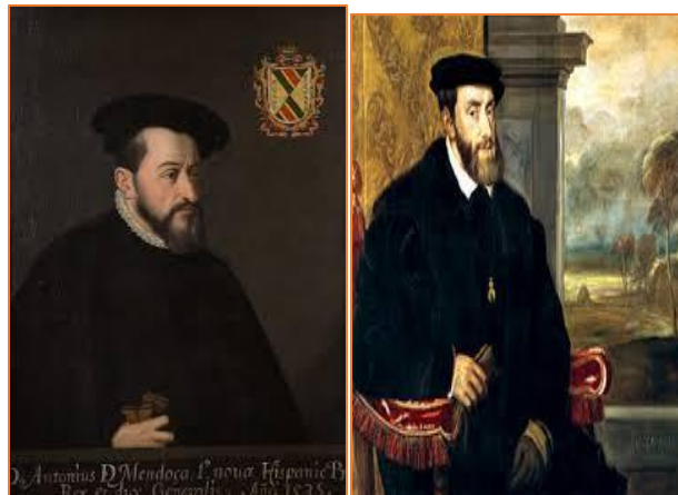
Rey de España Carlos I / Primer Virrey Antonio de Mendoza

En las costas dos puertos tuvieron gran actividad, Veracruz en el Golfo y Acapulco en el Pacífico.