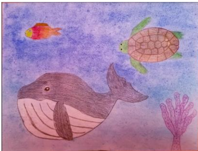
Dibujo de alumna Natalia Yatzil.

En el trabajo de Natalia, la proporción la puedes observar en la relación armónica y de tamaños que ocupan los animales marinos, los cuales corresponden a los que representan y que acomoda destacando a la ballena como el animal acuático más grande.