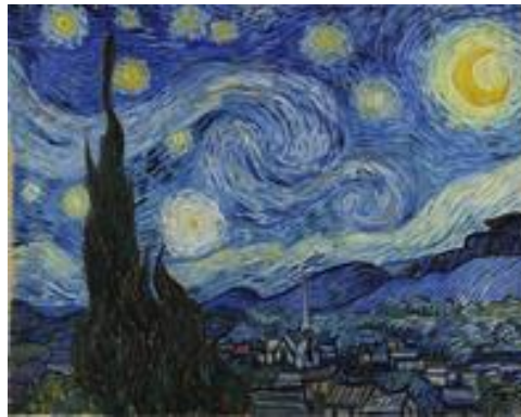
La noche estrellada, Vincent van Gogh (1889)

Entonces te invito a que veamos las siguientes pinturas y observes cómo algunos artistas utilizan estos principios de composición en sus obras.