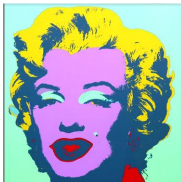
Marilyn Andy Warhol (1987)

Ves los colores amarillo y azul, blanco y negro, también se ve que tiene varias líneas y formas que parece que se mueve y la hacen ver muy bonita.