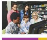
La salida de población altamente calificada a otros países es conocida como "fuga de cerebros".