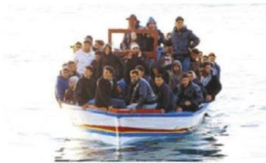
Figura 2.7 Migrantes de Oriente Medio arriban al puerto de Lampedusa, Italia.

Se trata de una causa política puesto que la inestabilidad del gobierno no puede garantizar seguridad a la población.