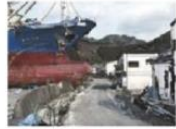
El tsunami de 2004 en el sureste asiático provocó la migración de miles de personas.